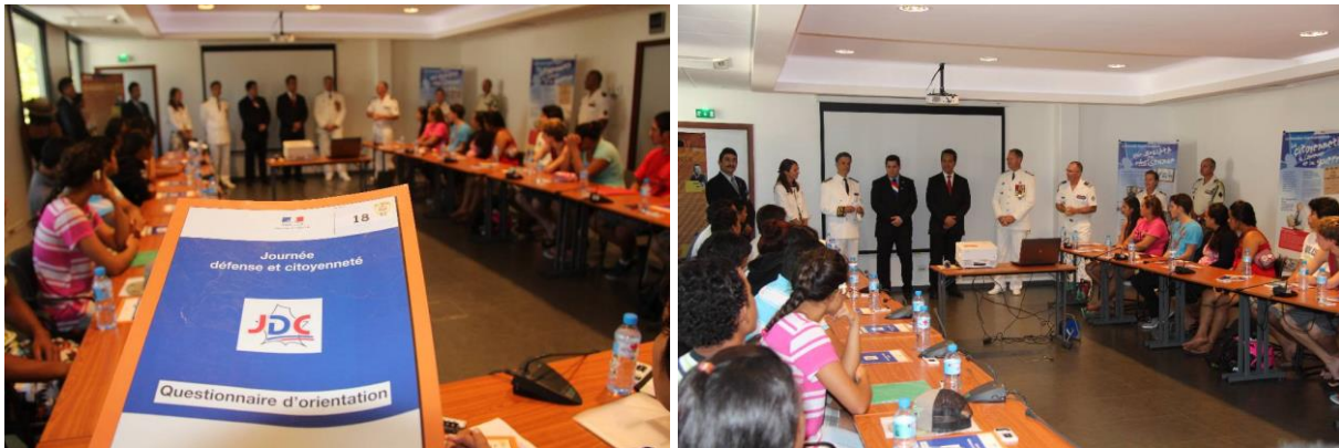
Photos d'archives de la JDC du 11 novembre 2014 dans les locaux du Haut-commissariat

La présence de jeunes convoqués en JDC à une cérémonie commémorative a pour but de sensibiliser les jeunes générations au devoir de mémoire.